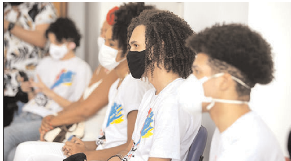
Inscrições estão abertas e podem ser feitas em um dos quatro Centros Comunitários da Paz

Posteriormente, os cursos oferecidos irão ser revezados entre os Compaz, dando a