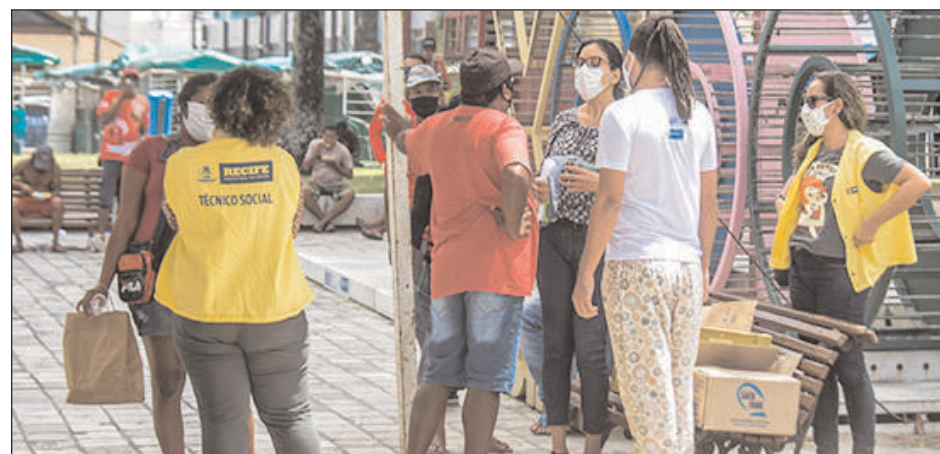
Na Praça de Boa Viagem, cerca de 50 pessoas receberam atendimentos e vacina contra gripe

Camila Borges destaca que a gestão municipal está preocupada com as pessoas