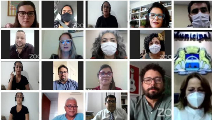
Lançamento da Frente Parlamentar pela Primeira Infância

A semana da Câmara Municipal do Recife foi marcada por diversos eventos, com destaque para a realização de duas reuniões solenes em que foram homenageados a Universidade Federal de Pernambuco (UFPE) e o Portal LeiaJa.com. Além disso, ocorreram reuniões de Comissões Permanentes da Casa, o lançamento da Frente Parlamentar pela Primeira Infância do Recife e a reunião da Frente Parlamentar pela Renda Básica. Todos os eventos, bem como as reuniões Ordinárias - nas segundas e terças-feiras, às 10h - ocorrem de forma virtual e podem ser acompanhados pelo site e pelo canal do Youtube da Câmara.